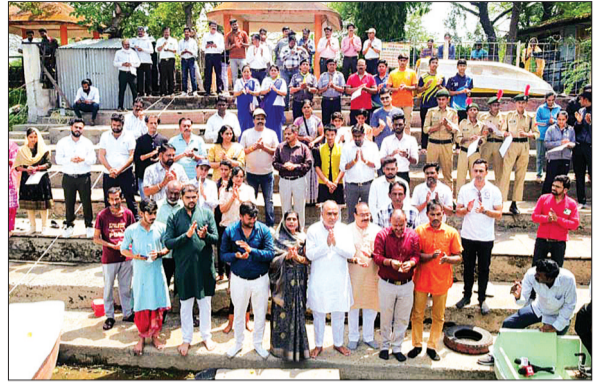
देवास। समापन अवसर पर मीठा तालाब पर हुआ कार्यक्रम।