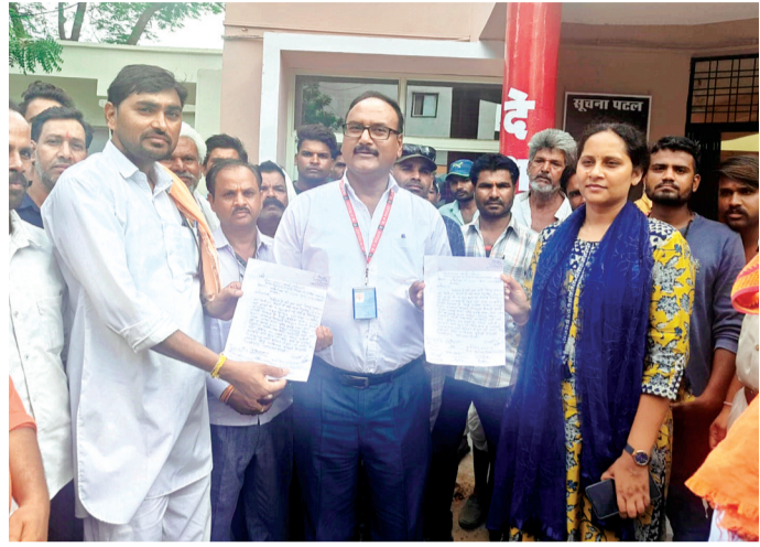
हरिभूमि न्यूज ▶ ब्यावरा-कुरावर

नाबालिग के साथ छेड़छाड़ के चलते कुरावर थाने में आरोपी पर पाँक्सो में मामला दर्ज हो गया है। चूंकि मामला दो समुदायों के बीच का है जिसको लेकर हिन्दू संगठनों ने आगे आकर आरोपी की संपत्ति को जमींदोज करने की मांग प्रशासन से की है। मामला कुरावर के समीपस्थ ग्राम शिवपुरा मेवाती का है। जहां पर शुक्रवार की रात 8 बजे के करीब अपने ही घर के आंगन में शौचालय का