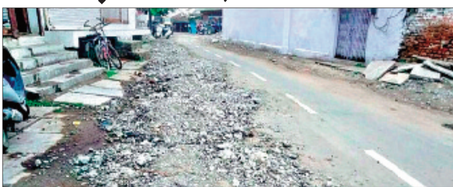
हरिभूमि न्यूज | सीहोर

शहर में कई जगह नल जल योजना के तहत पाइप लाइन डाली जा रही है तो कई जगह शहर के मेन रोड और कॉलोनी की अंदरूनी सड़कों पर अन्य काम के चलते रोड को खोदा जा रहा है। रोड खोदकर उसका मलबा