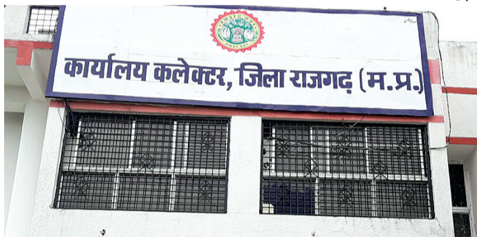
हरिभूमि न्यूज ▶ राजगढ़

जून मध्य से लेकर अगस्त मध्य तक का समय विभिन्न प्रकार की मछलियों के लिए प्रजननकाल का समय रहता है या दूसरे शब्दों में कहें तो मछलियां अंडे देती हैं। यही कारण है कि मछलियों का उत्पादन, वंशवृद्धि को बढ़ाने उक्त अवधि को मतस्यखेट के लिए प्रतिबंधित किया जाता