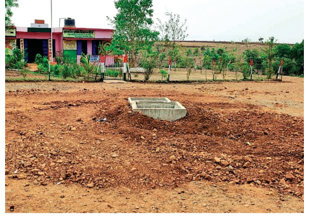
हरिभूमि न्यूज ▶ राजगढ़

हर घर, नल से जल पहुंचाने के उद्देश्य से पीएचई और जल निगम द्वारा संयुक्त रूप से योजना का क्रियान्वयन करवाया जा रहा है। इसके लिए गांव-गांव में पेयजल सप्लाई के लिए लाइन बिछाने के साथ ही उनके वाल्व चेंबर भी उचित स्थानों पर लगवाए जा रहे हैं। इन लाइनों और चेंबरों के निर्माण में कई जगहों पर अनदेखियां नजर आ रही हैं। कहीं लाइनों को बिछाकर फिर से सड़कों को रिपेयर नहीं करवाया गया है तो कहीं बैगरे टोटियां लगाए ही ग्रामीणों के घरों के सामने पाइपों को ऐसे ही पटक दिया गया है। अब लापरवाही का एक नया मामला सामने आया है। मुख्यालय से करीब 7, 8 किमी दूर कालीपीठ रोड स्थित प्राथमिक शाला कराड़िया के खेल मैदान के